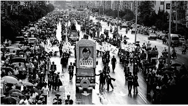
1989年5月19日送別鄭南榕在總統府前告別式