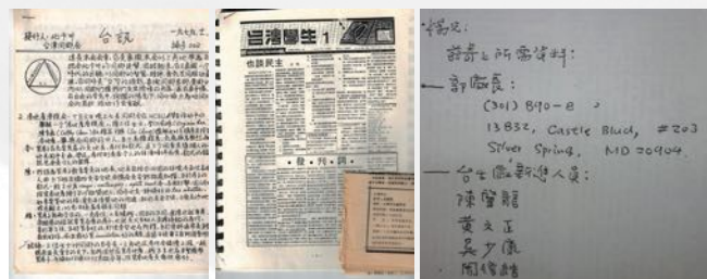
因出版刊物上黑名單

那個年代雖已遙遠但記憶猶新，我仍然覺得那幾年是我一生中最美好的時光。在北卡與我們為台灣打拚共事的那些人，直到今天仍然都是最好和最值得信賴的朋友。