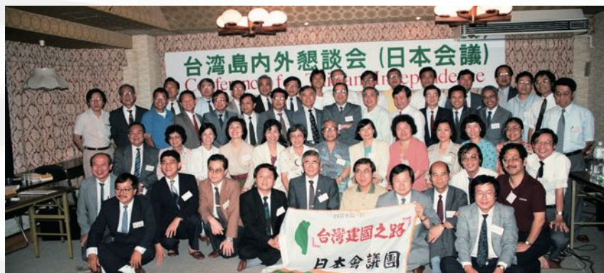
1991 年 8 月 13 日台灣島內外懇談會，多位全美會前會長都有參與在內。

在所有的黑名單中最後一個被解除返台限制的就是刺蔣案的主角黃文雄。在一次很偶然的機會下，陳菊在歐洲見到黃文雄。在陳菊的勸說下，黃文雄終於考慮要鮭魚返鄉。1996 年 5 月 6 日，黃文雄闖關入境。二年後，1998 年 11 月 10 日，黃文雄被政府查獲，控以違反國家安全法第三條，未得許可入境罪名起訴。國民黨的「黑名單」禁令至此才真正解除。