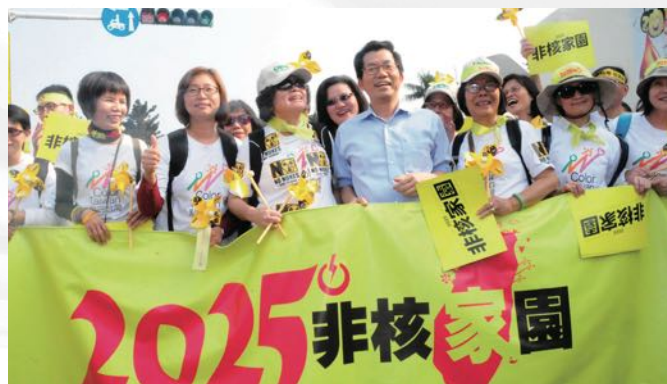
2015 年 3 月以蔡英文競選總統主張推動「2025 非核家園」的夢想

李應元曾交給我一隻 007 手提箱代為保管，1992 年 5 月 23 日李應元和其他同志獲無罪釋放出獄。手提箱也順利交給他的弟弟李宗明，2000 年 3 月政黨輪替，陳水扁任命李應元在當年 11 月出任駐美副代表，為民進黨首位駐美外交官，2001 年應元前來 KC 考查，亦應同鄉之邀，出席同鄉會的晚宴