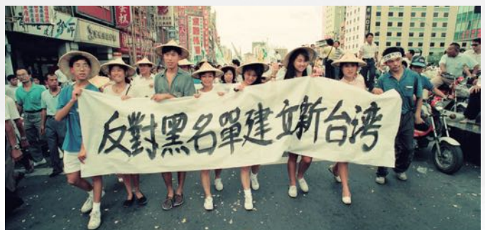
1989年8月11日在高雄主辦第16屆世台會以「反對黑名單及建立新台灣」訴求