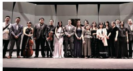
2019 年美東台灣人夏令會王康陸紀念音樂會